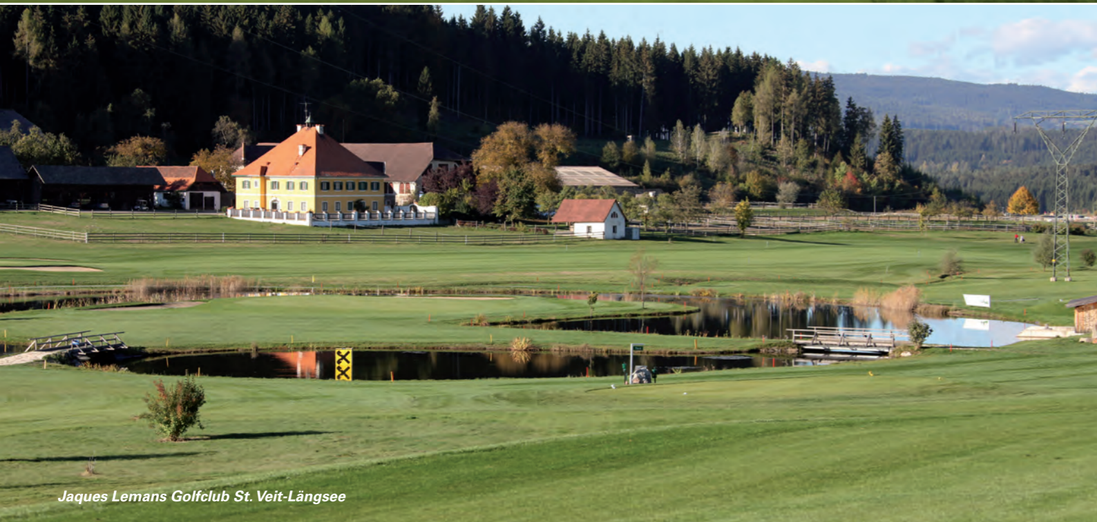
Jaques Lemans Golfclub St. Veit-Längsee

ungsreise durch Kärnten – egal ob im einfachen Gasthaus am Land oder beim Hauben-Koch auf der der Seeterrasse – liefert auch der Slow Food Guide 2024, ab sofort bei der Kärnten Werbung unter https://www.kaernten.at/slowfoodguide/ erhältlich. Er listet Restaurants, Almhütten, Hofläden und mehr auf.