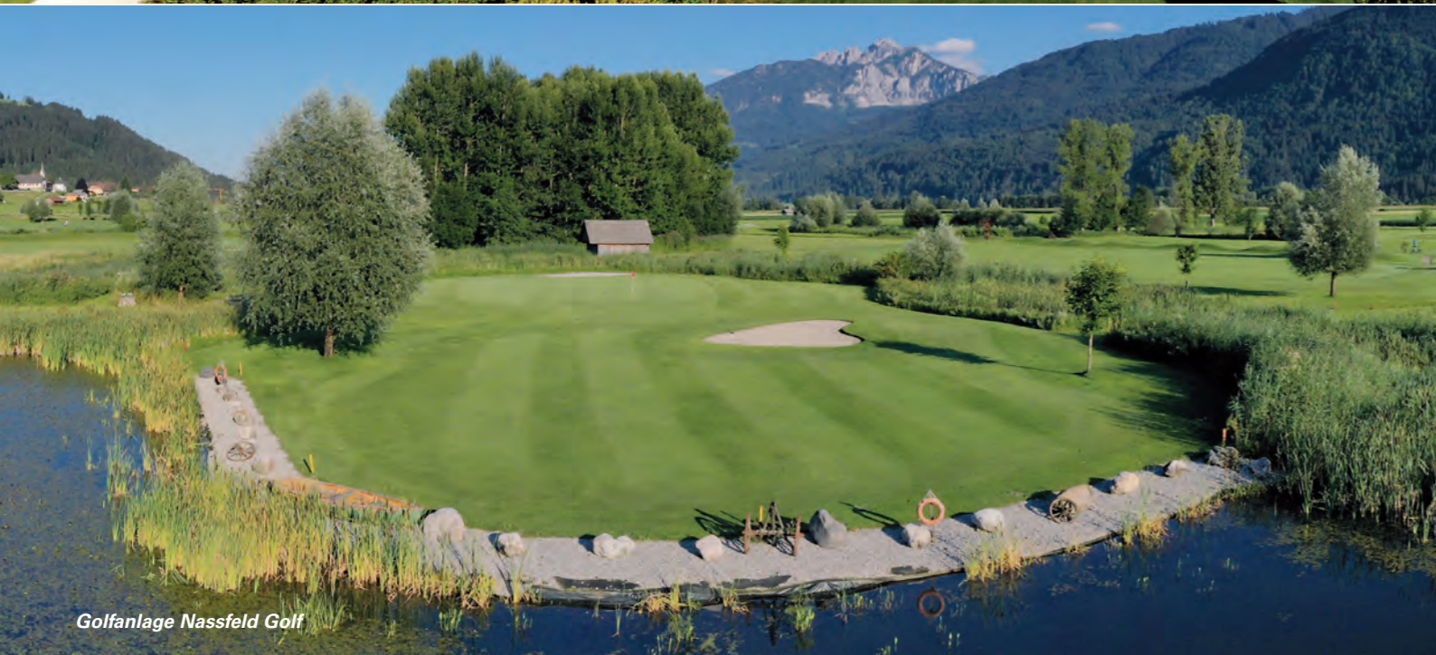
Golfanlage Nassfeld Golf