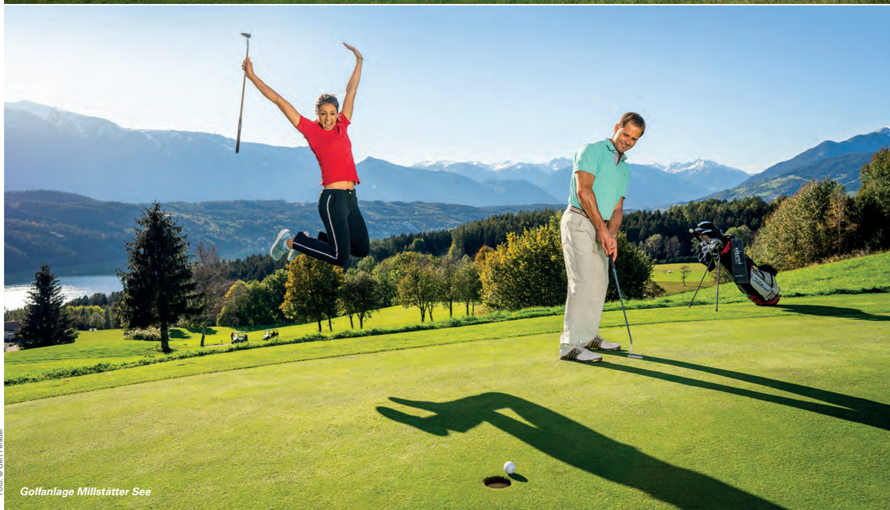
Golfanlage Millstätter See