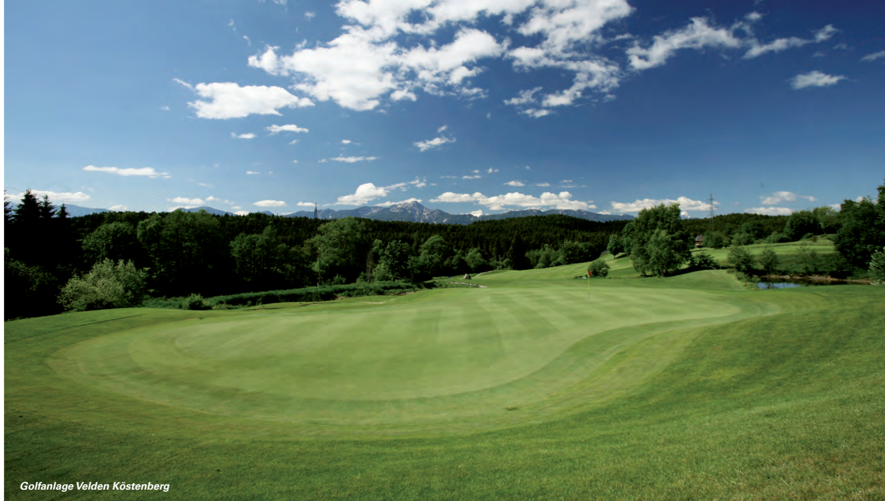
Golfanlage Velden Köstenberg

KONKRETE BUCHUNGSANGEBOTE für Ihren Golfurlaub in Kärnten finden sie unter www.karnten.at/golf/angebote/