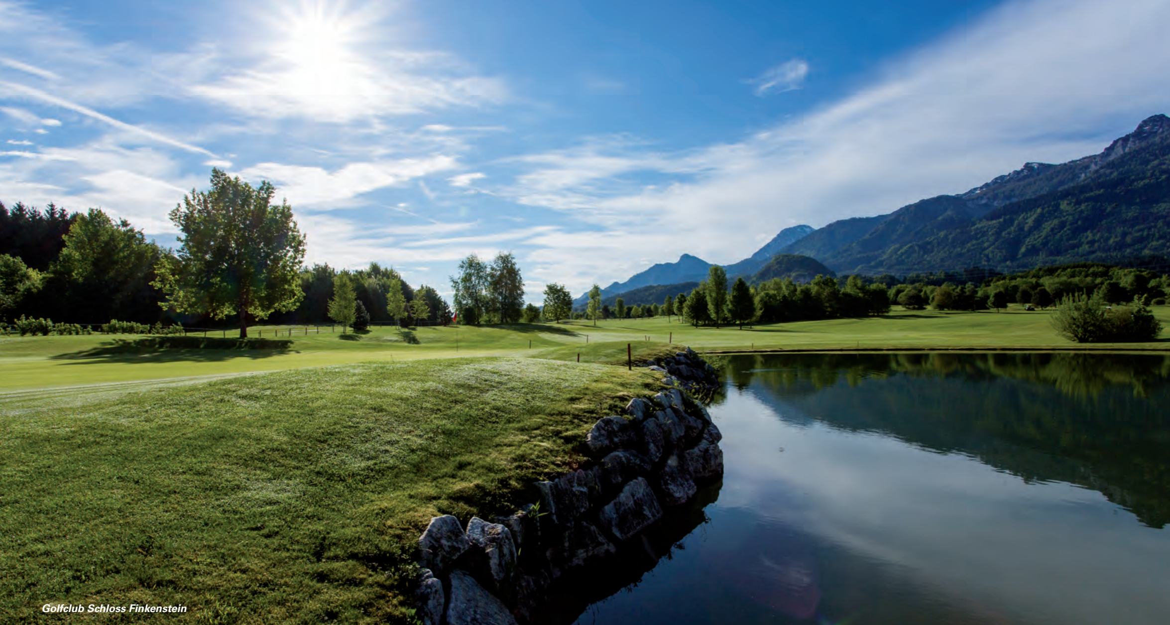
Golfclub Schloss Finkenstein