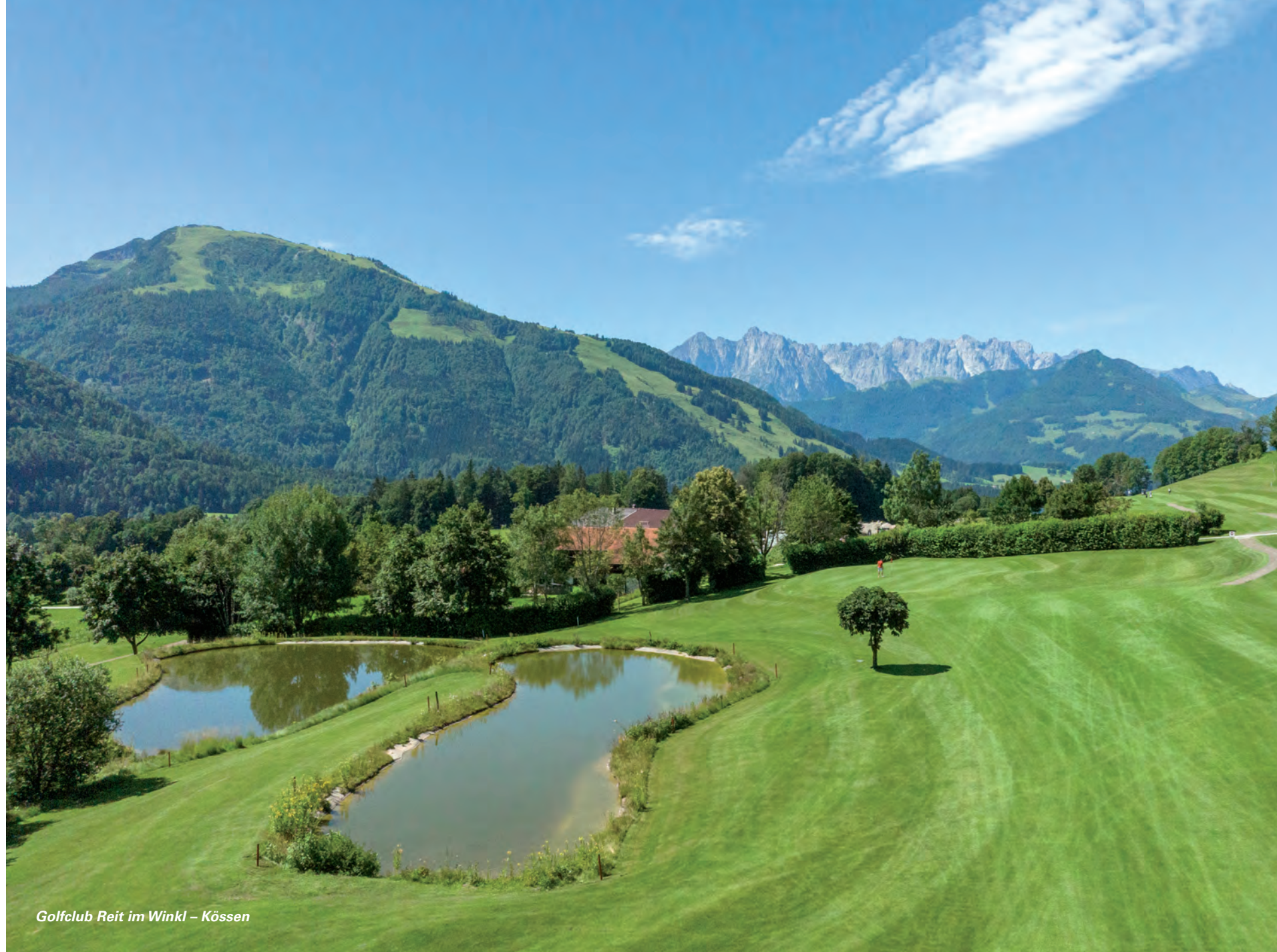
Golfclub Reit im Winkl – Kössen