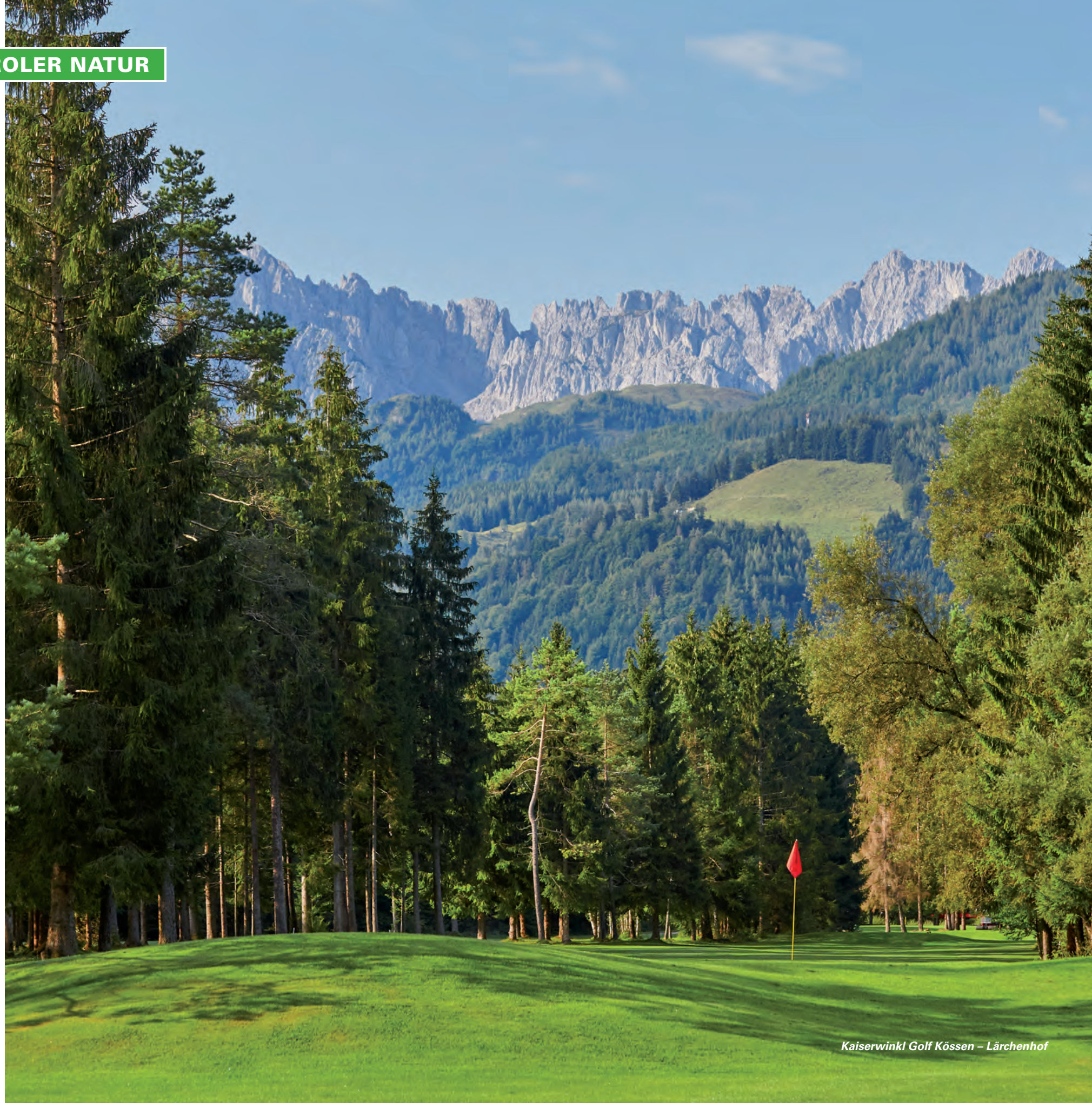
Kaiserwinkl Golf Kössen – Lärchenhof