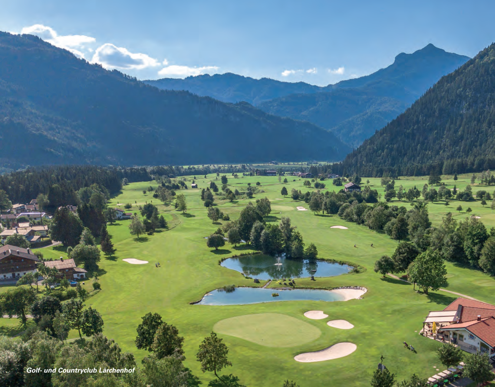
Golf- und Countryclub Lärchenhof