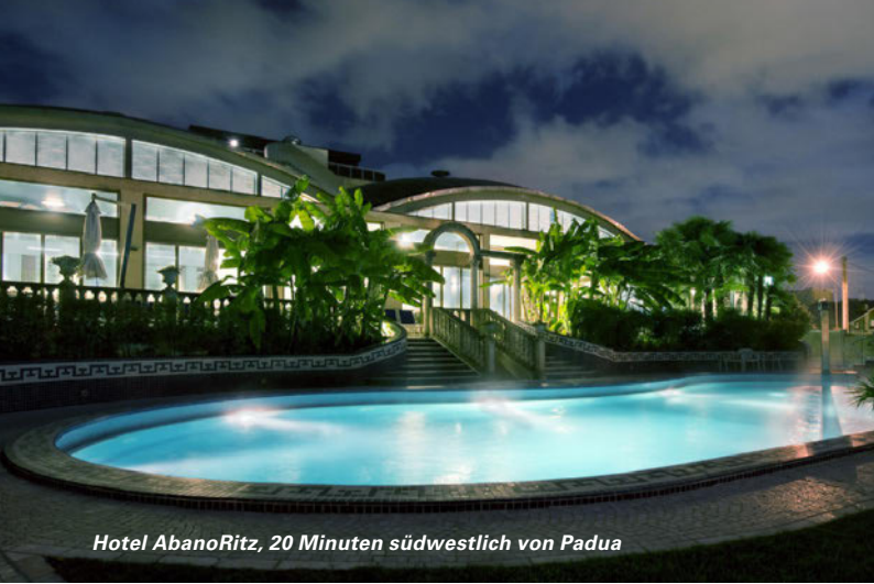
Hotel AbanoRitz, 20 Minuten südwestlich von Padua